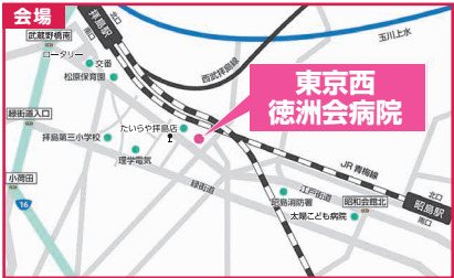
東京西徳洲会病院 042-500-4433 昭島市松原町3-1-1