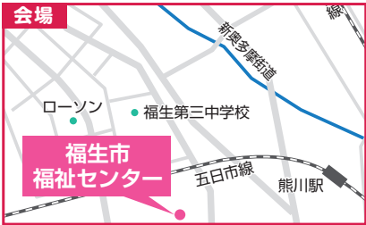
福生市福祉センター 地下 研修室 福生市南田園2-13-1

糖尿病教室 は感染対策のため、 事前申込制 とさせていただきます。参加希望の方は平日9-17時の間にお電話をいただくか、オンライン健康講座と同様にお問い合わせメールにて前日17時までにお申込みをお願いします。また当日は 1階の受付(医事課) まで、お声かけください。